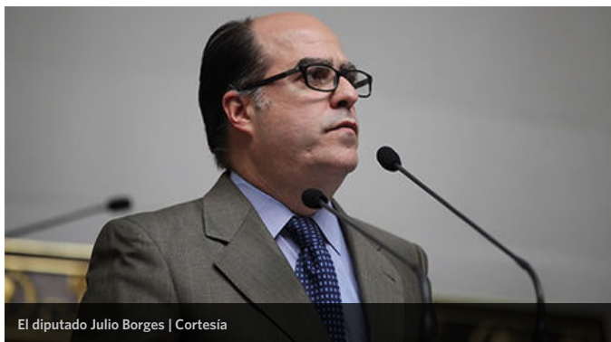
El diputado Julio Borges

Sobre el diálogo que promueve la Unasur, Borges sostiene: "Lo decidido por la Unidad es que el único diálogo es a través del voto"