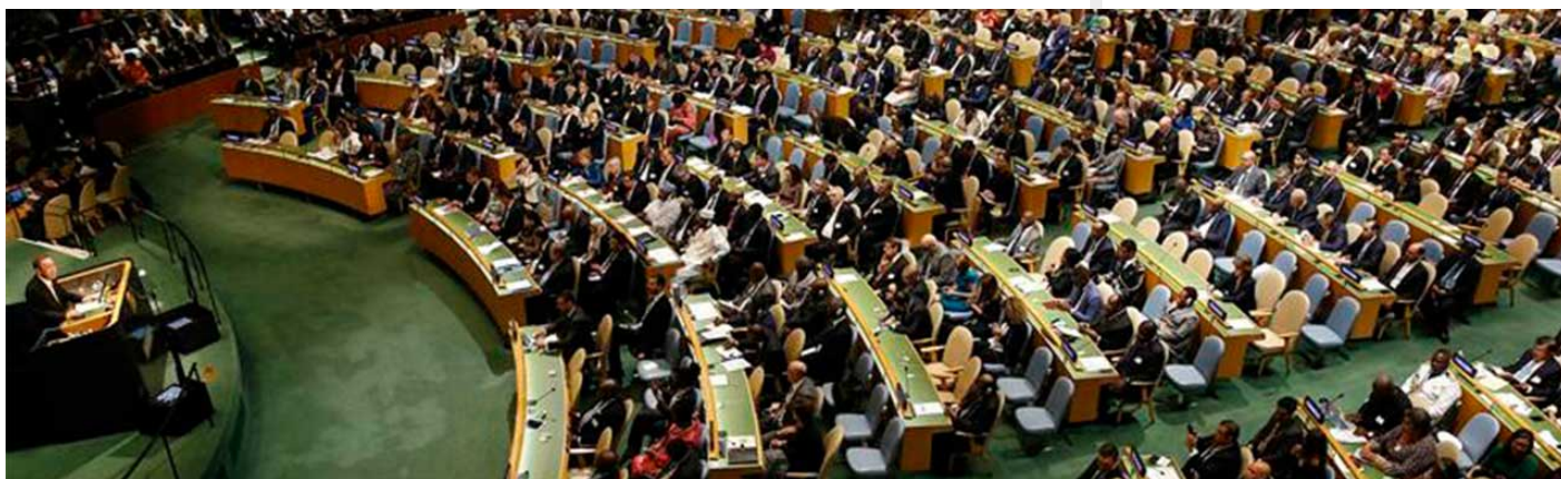
Asamblea General de la ONU