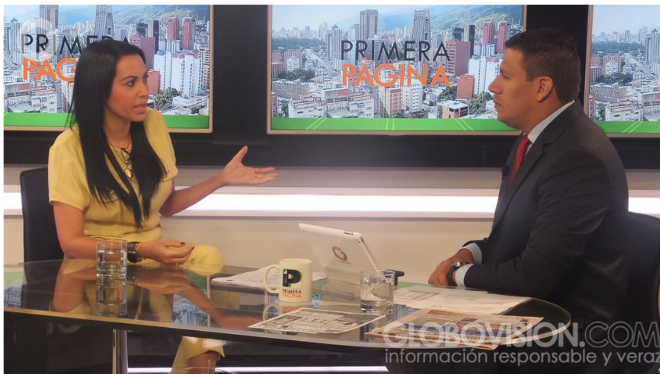
Diputada Delsa Solórzano

La diputada a la Asamblea Nacional por la Mesa de la Unidad Democrática (MUD), Delsa Solórzano, aseguró que la oposición discute una hoja de ruta y el próximo lunes, a las 10:00 a.m., informará en un acto de masas en el Parque Miranda de Caracas los pasos a seguir tras el anuncio del Consejo Nacional Electoral (CNE) sobre el referendo revocatorio.