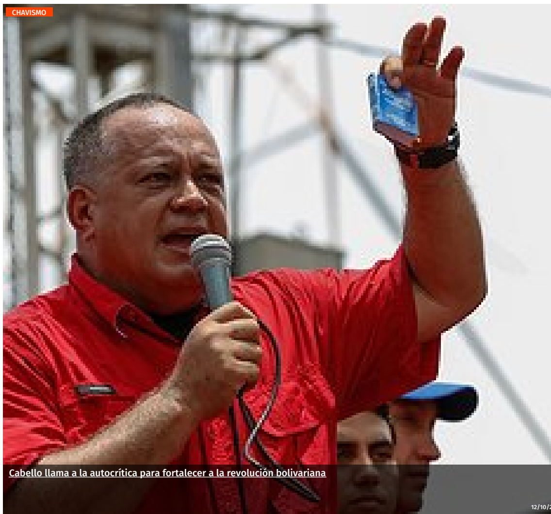
Cabello llama a la autocrítica para fortalecer a la revolución bolivariana